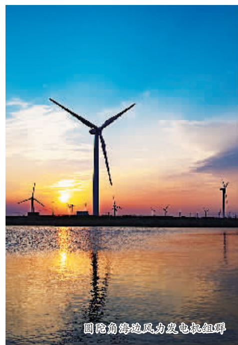
圆陀角海边风力发电机组群