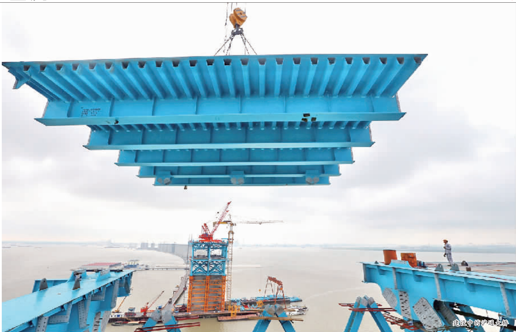
建设中的沪甬大桥